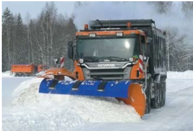
Сравнительное испытание техники

проводим совместно с Федеральным дорожным агентством, дают возможность на практике определить слабые места и оценить преимущества лучших образцов, включая зарубежные.